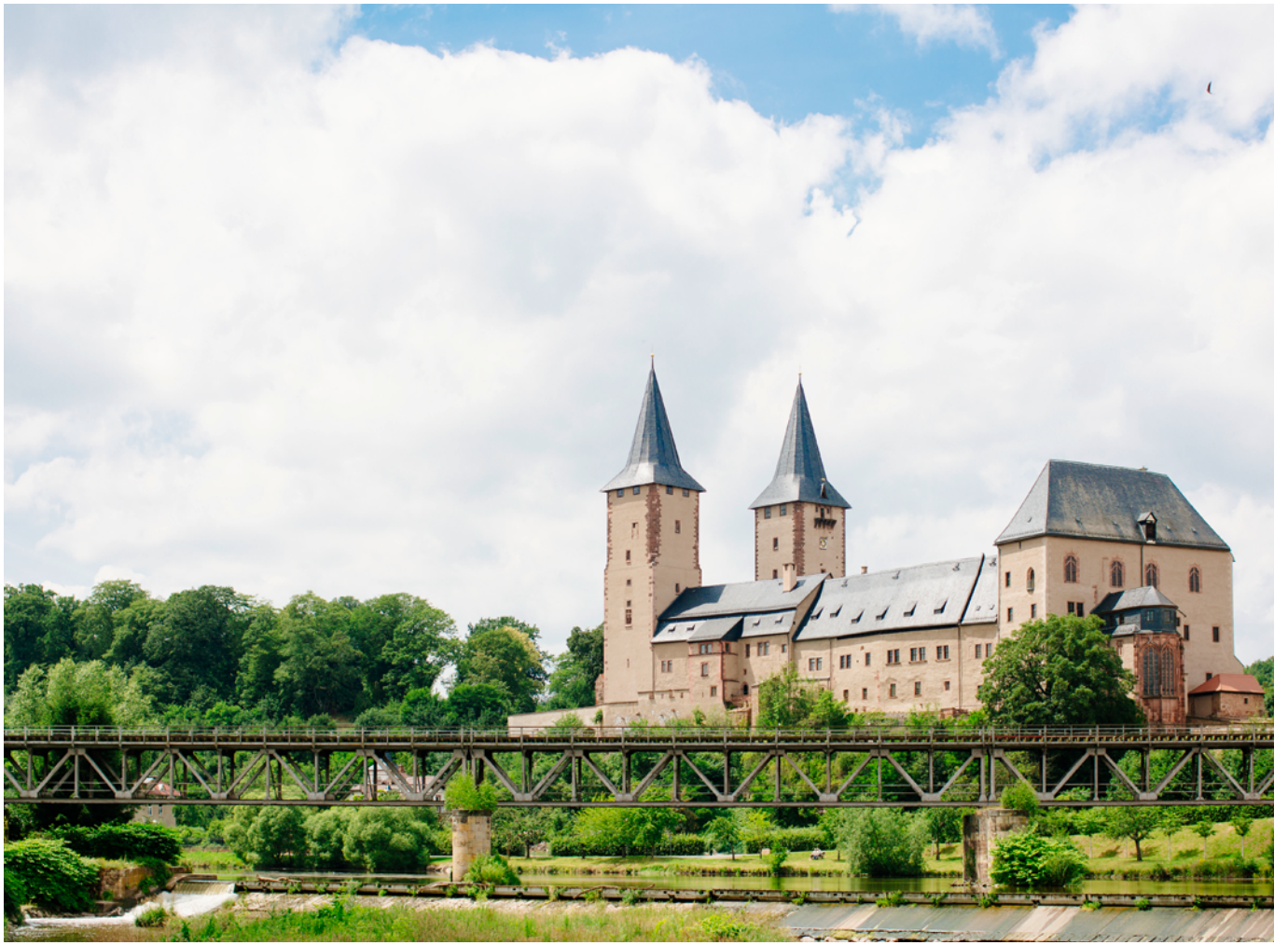
Schloss Rochlitz 24