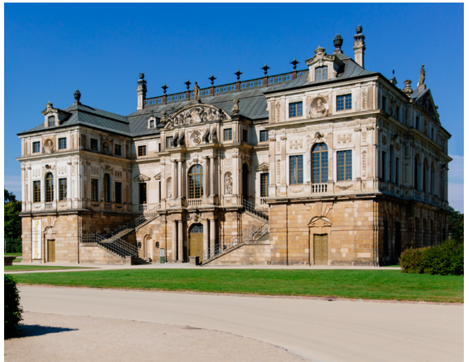
Großer Garten Dresden 34