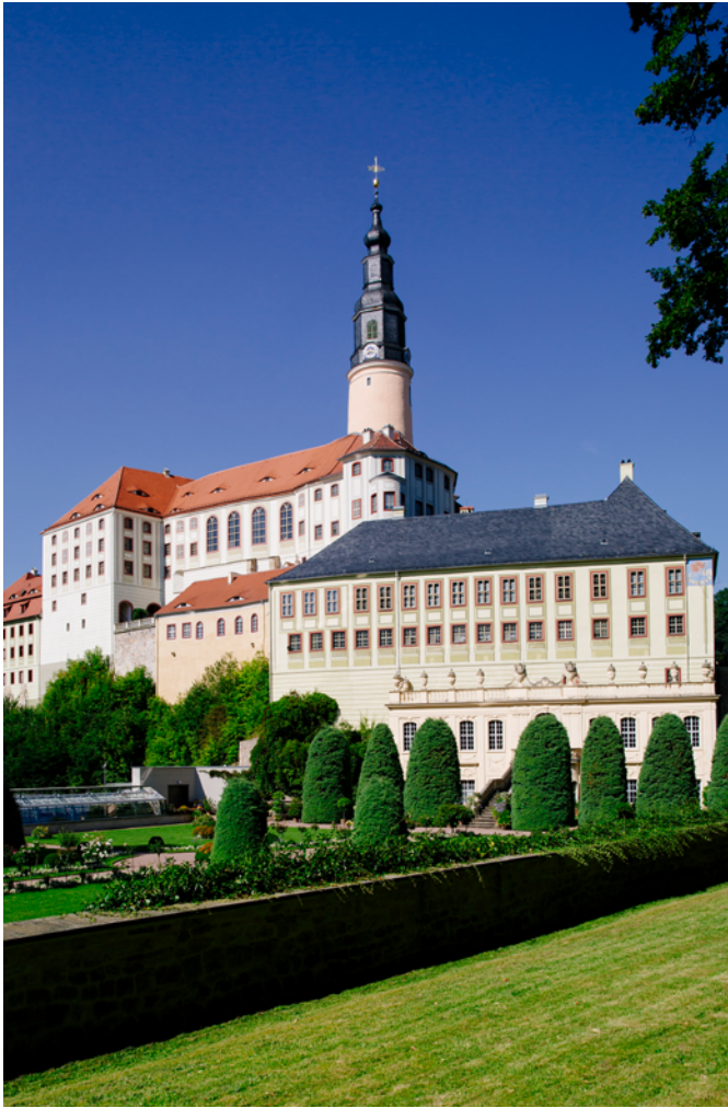
Schloss Weesenstein 26