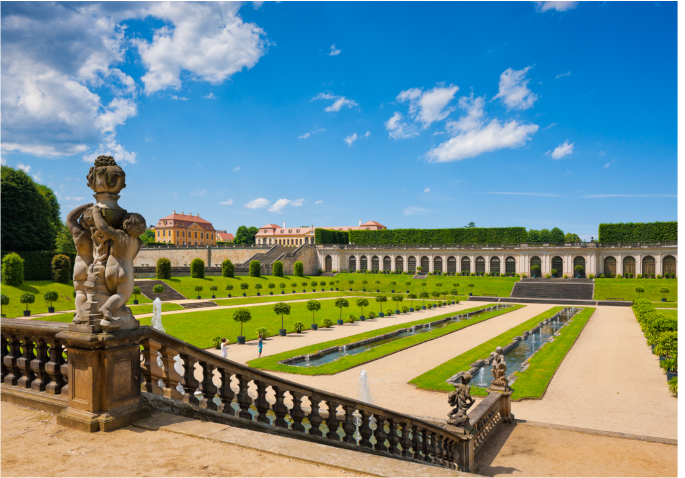
Barockgarten Großsedlitz 44